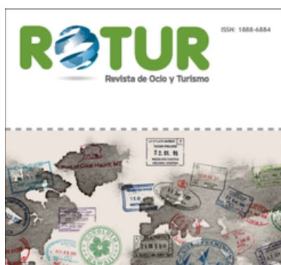
ROTUR. Revista de Ocio y Turismo