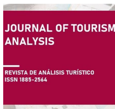
Journal of Tourism Analysis (ITA).