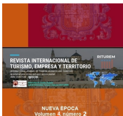
Revista Internacional de Turismo, Empresa y Territorio