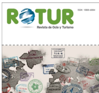
ROTUR. Revista de Ocio y Turismo