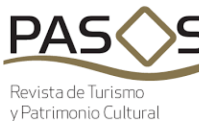
Pasos. Revista de Turismo y Patrimonio cultural