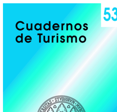
Cuadernos de Turismo