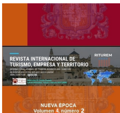
Revista Internacional de Turismo, Empresa y Territorio