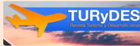
TURyDES, Turismo y Desarrollo Local Vol. 9. Nº 21 (2016) p. 27-33

Dada la relevancia que actualmente representa el cicloturismo en Europa, el objetivo de este trabajo es mostrar los rasgos diferenciadores que postulan al cicloturismo como una modalidad turística sostenible y generadora de valor para los destinos turísticos. Para ello, se analiza la conceptualización y modalidades existentes, los beneficios generados, así como las políticas desarrolladas e impulsadas en seno de la Unión Europea (UE) para su éxito turístico. Finalmente, se exponen los principales recursos disponibles para su práctica. (Texto completo)